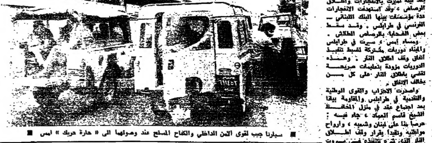
سيارة جيب تقوى الأمن الداخلي والقوات المسلحة عند وصولها الى «حارة حريك» امس

سلام: واجب العقلاء اليوم هو وضنق الفتنة اعلان الرئيس صائب سلام امس، ان واجب العقلاء في الدرجة الاولى، هو العمل بخلص على خلق الفتنة، ومثل ان السن والحفاظ عليه، والمودة الى الاستقرار، ما ينظفه الجميع الآن. وقال الرئيس سلام في تصريحه: احب ان اقول بصراحة، انه لا يجوز